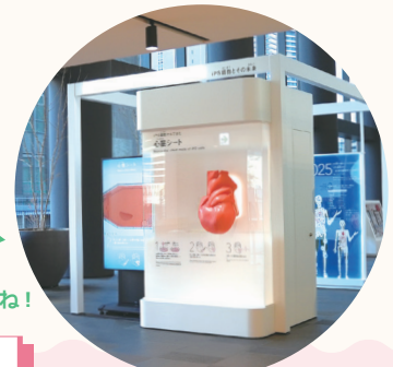
2025 大阪・関西万博 レガシー展示

NQパビリオン～いのちの鼓動館～ 「iPS Cells for the Future」の常設展示も見てね！